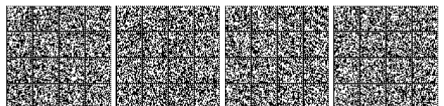
Tabella 3: Misure gestionali per il livello di prestazione 3