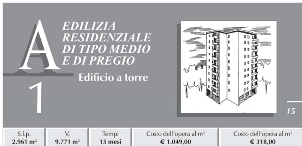
TABELLA RIASSUNTIVA DEI COSTI E PERCENTUALI D'INCIDENZA