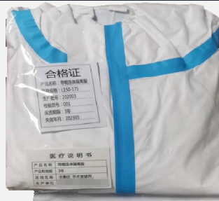
Tuta non medicale