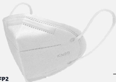
Mascherina Fitrante FFP2