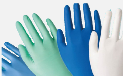
Guanti monouso 100pz