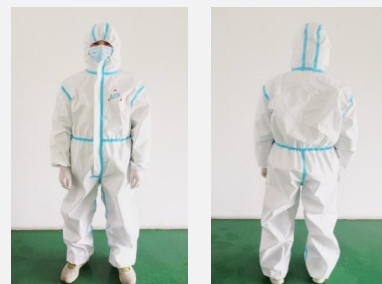
Tuta grado medico